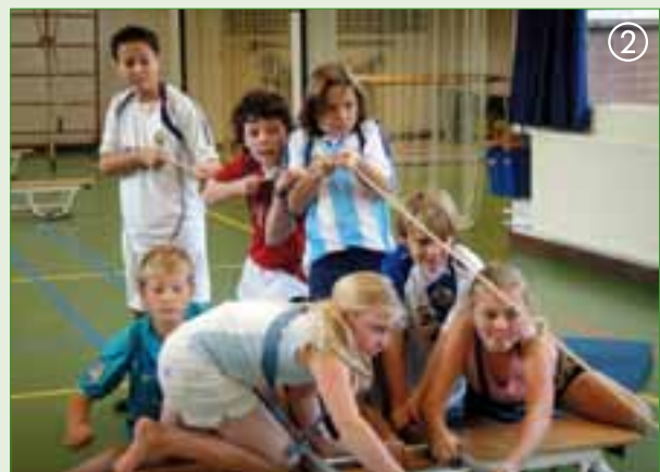
Over het tweede ravijn

Vanaf dit moment wordt iemand ziek. Het matje wordt op de ladder gelegd, de zieke erop en de kinderen gaan enthousiast de mat over de ladder schuiven. Hierbij hebben ze niet in de gaten, dat de ladder ook gaat verschuiven en met een luide klap in het ravijn terecht komt. Opnieuw beginnen! Wat is de oplossing? Eerst moet er iemand naar de overkant om het touw los te maken. Dat zit toch maar in de weg. Dan houdt die persoon al knielende de ladder tegen, terwijl een kind op de ladder de mat gaat trekken en de anderen de mat gaan schuiven. Is de mat aan het eind van de ladder gekomen, dan mag de zieke er af. De kinderen weten maar al te goed dat ze er bijna zijn en stuiven over de ladder. Wijs ze er op dat ze rustig moeten blijven, want een fout is zo gemaakt. De ladder meenemen is voor velen een fluitje van een cent. Het touwtje vastmaken aan de ladder en deze net een ophaalbrug omhoog trekken. Als dit gelukt is, is de klus geklaard! De groep heeft een punt gehaald en mag proberen een tweede punt te halen.