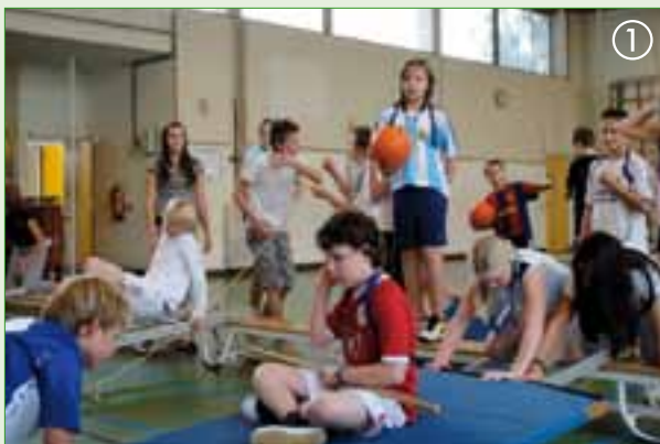
De ladder over het ravijn krijgen.....spannend!